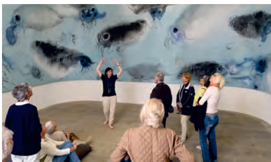
Visite de la fondation Carmignac à Porquerolles, le 25 mai.