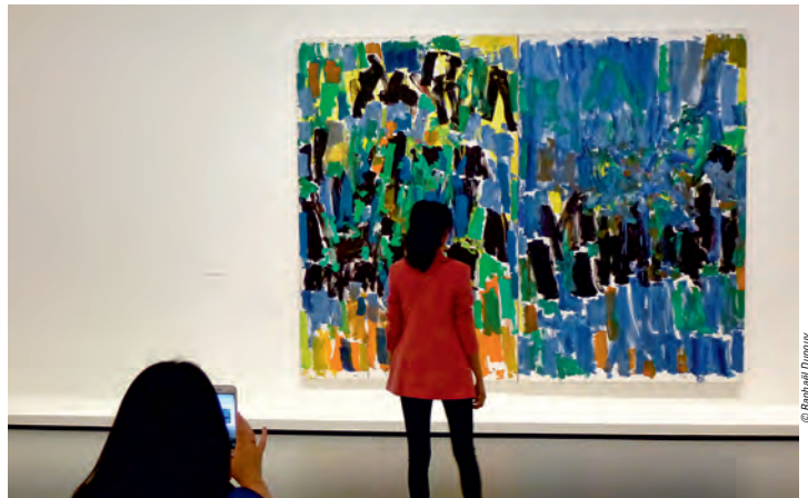
Plusieurs expositions en France ont souligné, ces dernières années, l'importance de l'œuvre de Joan Mitchell, comme celle de la collection de la Fondation Louis Vuitton cet été à Paris.

"Pour aimer Joan Mitchell, il faut aimer la peinture. Non pas la peinture qui raconte, ou la peinture qui illustre ou qui représente, mais la peinture pour elle-même, dans sa couleur, sa matérialité, dans le geste qui la fait venir sur la toile. La peinture poème ou la peinture sonate. Ses grands tableaux sont-ils abstraits, ou sont-ils une plongée dans l'intime de la nature, l'énigme de sa présence? On ne le sait pas trop. Ils sont en tout cas le lieu d'une expérience sensible et sensuelle. D'une profonde impression. On a pu parler à son propos d'ailleurs d'impressionnisme abstrait, comme on aurait pu le faire à propos des derniers Monet, ceux des années 1920, quand les Nymphéas eux-mêmes ne sont plus que des jetées de couleur sur la toile" écrivait le journal L'Humanité à l'occasion d'une exposition à Caen en 2014.