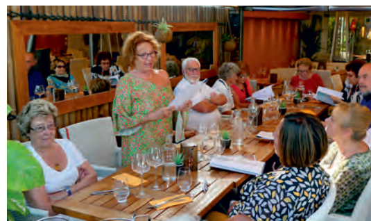
Lors de la soirée annuelle de l'atelier d'écriture, le 22 juin.