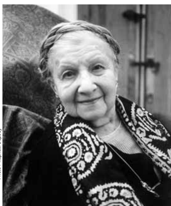
Denise Colomb rencontrée chez elle, en janvier 2002. Toujours coquette à 100 ans.

Disparue le 1 er janvier dernier, la photographe nous avait reçus en 2002