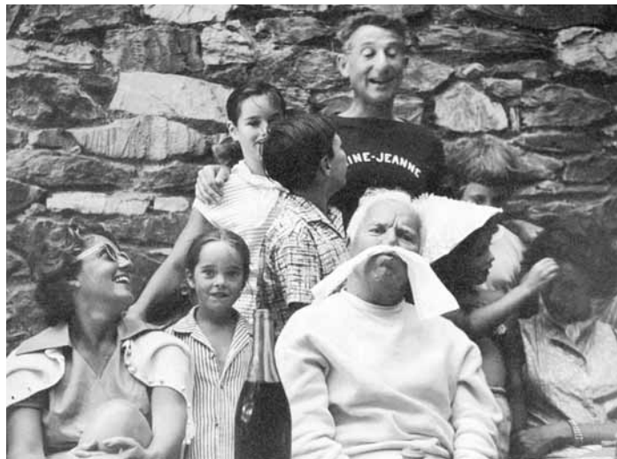
Charlie Chaplin en vacances avec sa famille à Cabasson.