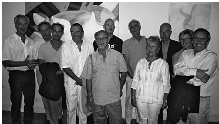
Artistes, élus et organisateurs lors du vernissage le 1 septembre dernier au musée de Bormes.

"Près de 40 œuvres pour 25 artistes qui,