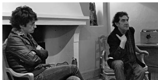
... lors de cette rencontre littéraire, peu avant Noël, au coin du feu.