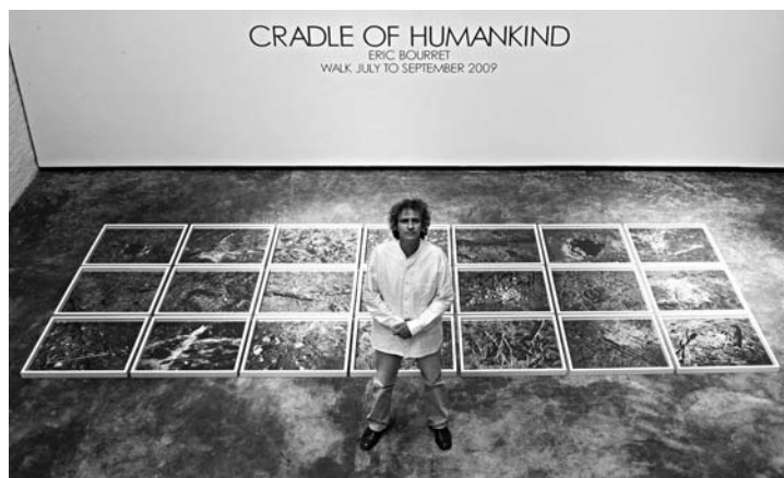
Le photographe Eric Bourret lors de sa récente exposition en Afrique du Sud.

Organisateur depuis 1995 du "Bol d'Art", le "Réseau Lalan" reconduit en mars 2011 son nouveau rendez-vous culturel consacré à la photographie; manifestation qui investira, comme en 2010, l'Espace culturel du Lavandou avec deux photographes voyageurs: Eric Bourret et Gautier Deblonde, deux artistes quadragénaires dont la notoriété est désormais internationale. Déjà! Initié en 2008 avec la participation active de Frank Horvat, cet événement a évolué en 2009 en "Déambulations photographiques" avec le Marseillais Gilbert Garcin parrainant d'autres photographes de la région, puis avec Sabine Weiss et Stéphanie Tétu en 2010. Heureux de cette dernière édition, le Réseau Lalan reconduit l'idée d'une exposition présentant côte à côte deux artistes dont les univers peuvent dialoguer.