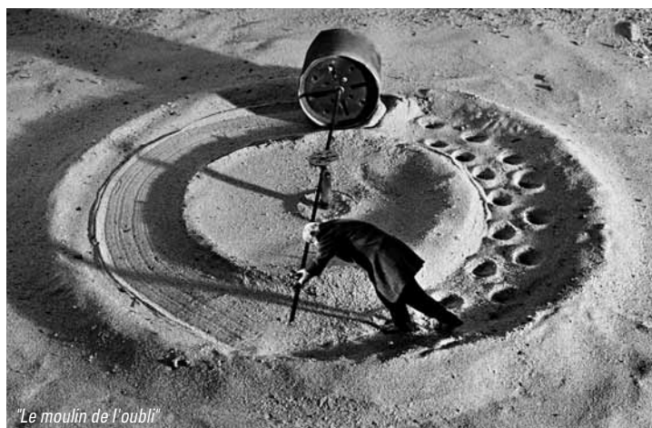
"Le moulin de l'oubli"