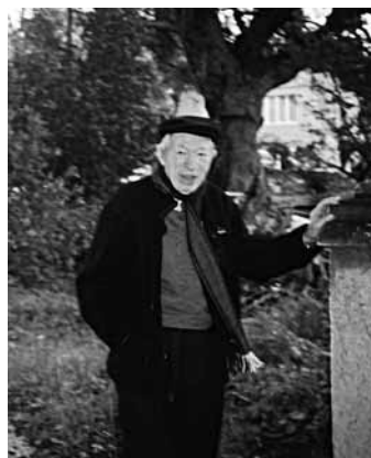
William Jay Smith, membre de l'Académie américaine, devant la villa "Le Pin".