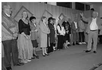
La pièce "Au musée" jouée le 19 décembre au Lavandou, puis le 27 mars à Bormes.