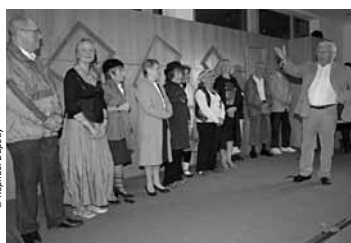
La pièce "Au musée" jouée le 19 décembre au Lavandou, puis le 27 mars à Bormes.