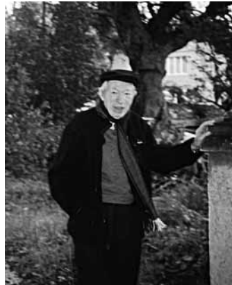
William Jay Smith, membre de l'Académie américaine, devant la villa "Le Pin".