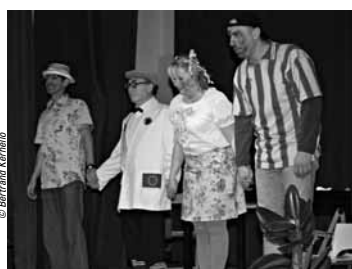
Succès borméen pour "Vive Bouchon" le 31 janvier.

le même bonheur, le 27 mars prochain, à la salle des fêtes du village médiéval. Entre temps, dans ce même lieu, le Réseau Lalan a invité le 31 janvier la troupe du Théâtre de l'Éventail, (également animée par Jean Sourbier) à présenter sa pièce "Vive Bouchon", bonne comédie de Jean Dell et Gérard Sibleyras. Un moment très apprécié également.