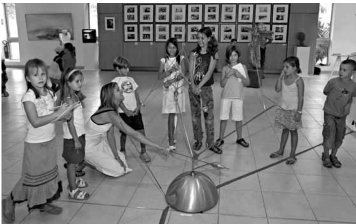
Visite de scolaires à l'occasion de l'exposition "Autour de Marcel Van Thienen".

Durant l'été 2008, Le Lavandou a réuni les amis du sculpteur disparu en 1998